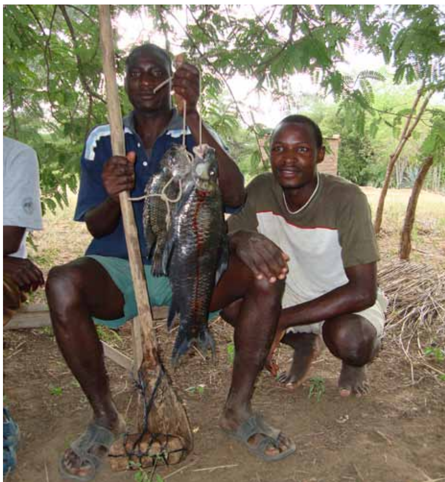
Den mektige floden Zambezi renner like forbi den skogrike IBAen Mutulanganga. Med støtte fra ZOS har landsbyboerne kjøpt riktig fiskeutstyr, som gir bedre og mer bærekraftige resultater enn fiske med myggnetting og gift. Andre har fått støtte til innkjøp av geiter eller hjelp til å skaffe råmaterialer til kunsthåndverk.

Fregneskjeggfugl finnes utelukkende i Zambia, og svartkinnet dvergpapegøye nesten bare i Zambia. Også treskonebb, ruststrupehegre og vortetrane er spesialiteter for Zambia, som har betydelige deler av verdenspopulasjonen. De ulike rødlistekategoriene er presentert i artikkelen om den nye norske fuglerødlista i dette heftet.