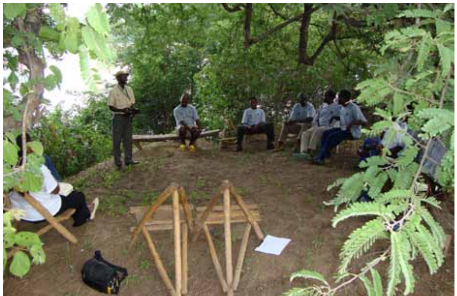
Møter og rådslagning er viktig i mange afrikanske kulturer. Her er styret i den lokale støt-tegruppa i Mutlanganga samlet under et stort tre ved landsbyen for å fortelle meg om sine aktiviteter og planer.