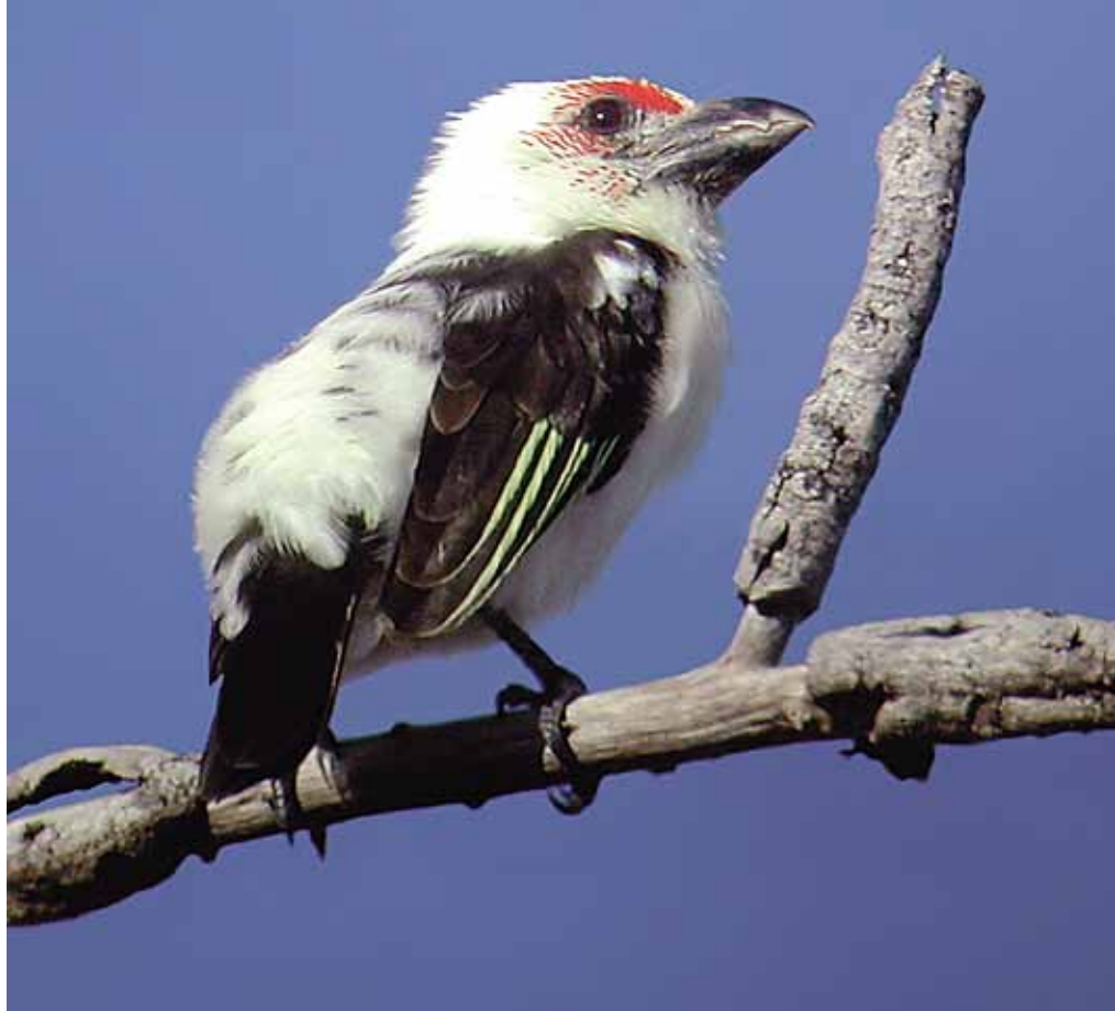
Fregneskjeggfugl Lybius chaplini er en endemisk art for Zambia og heter «Zambian barbet» på engelsk. Arten er rødlistet som «sårbar» som følge av bestandsnedgang, og det er trolig færre enn 3000 par.

I Mutulanganga sørøst i Zambia var landsbyhøvdingen klar til protestaksjoner for å stanse en massiv hogst det var