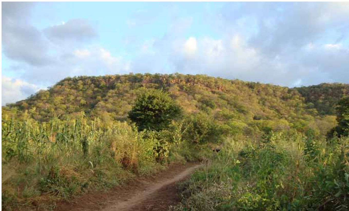
Zambisk landskap med en liten maisåker i forgrunnen fra Zambezi-dalen, nær IBAen Mutulanganga.