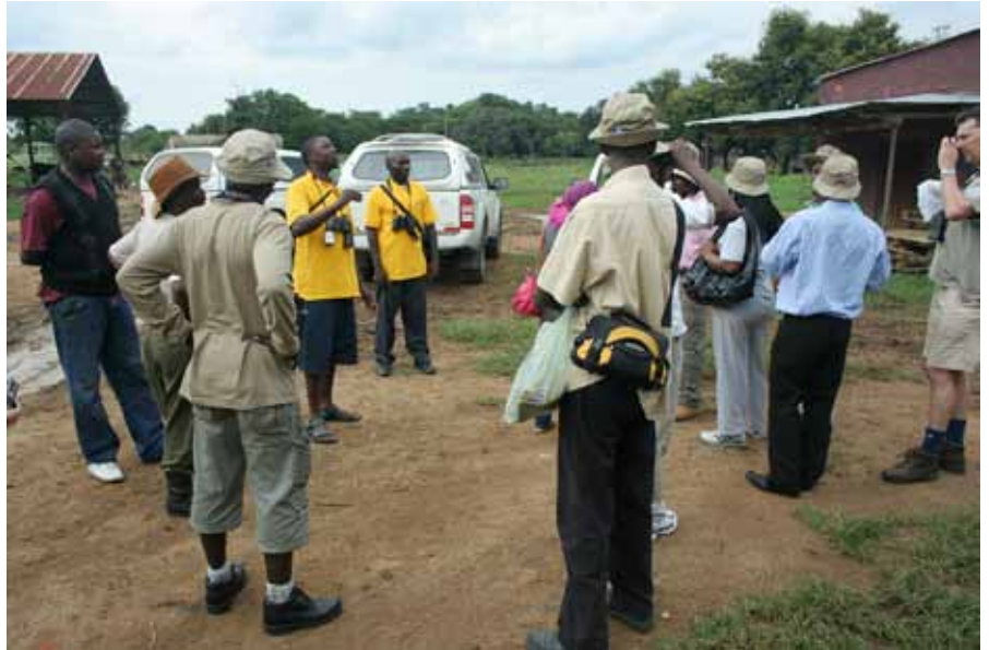
I flere IBAs arbeider man med å tilrettelegge enkle steder der fugleturister kan campe i nærheten av landsbyene, og få tilgang til vann, mat og guiding. Her forteller folk fra den lokale gruppa, iført t-skjorter fra ZOS, om store planer ved bredden av Zambezi. På bildet under er folk i sving med å produsere byggesteiner til enkle bygninger på campingplassen.

Forfatterens adresse: Solstugrenda 40 0671 Oslo christian@steel.no