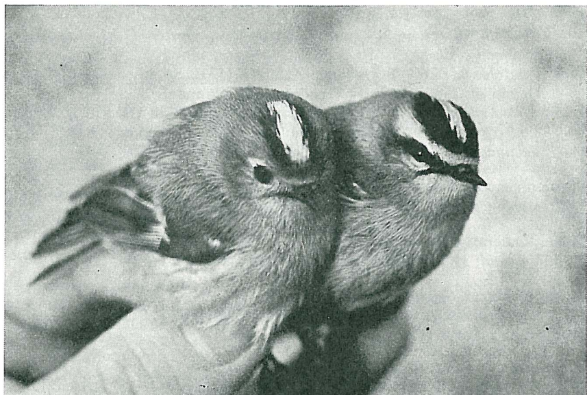
Fig. 2. Den niende rødtoppete fuglekongen, Regulus ignicapillus , i Norge sammen med fuglekonge, R. regulus , Svenner, Stavern, Vestfold, 26. april 1973. — The ninth Firecrest, Regulus ignicapillus, in Norway together with a Goldcrest, R. regulus, Svenner, Stavern, Co. Vestfold, 26 April 1973.

1974: Telemark : 10.4.* Stråholmen (Lifjeld & Gravklev 1975). Telemarksfunnet i 1974 representerer det tiende funn av arten i landet.