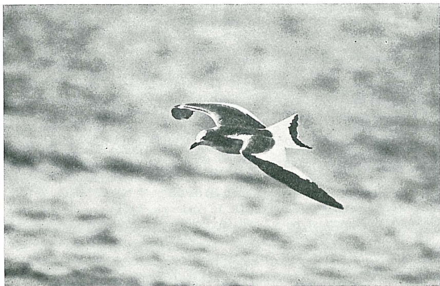
Fig. 1. Sabinemåke, Larus sabini , i første kalenderår, Mølen, Brunlanes, Vestfold, 26. sept. 1975. — First year Sabine's Gull, Larus sabini, at Mølen, Brunlanes, Co. Vestfold, 26. Sept. 1975.