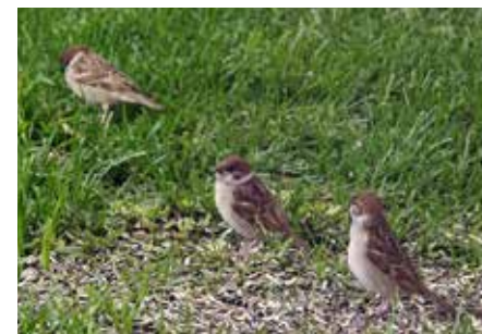
Bilde 5. Pilfink på Herøy, Silvalen. To ungfugler i forgrunnen.

Lofoten (enkeltindivider). På Løkta i Dønna kommune ble ca. 20 individer observert i oktober, så det virker sannsynlig at det har vært hekking også der i 2015.