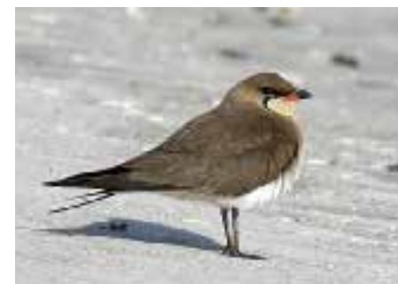
Brakksvale, Meløy.

MELØY: 1 ad. Bolga 29-31.5 (*Margareth Gransjøen, *Kjetil Larsen, Marianne Hegge Skogsholm m.fl.).