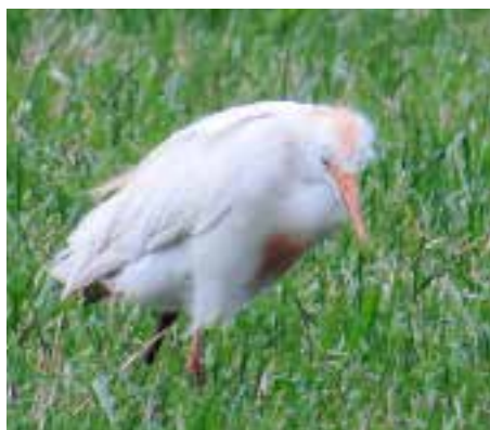
Kuhegre, Bodø.