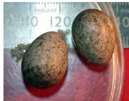
Bilde 4. Råteegg etter pilfink, 2015. Lengde ca. 20 mm.