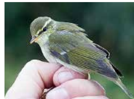
Lappsanger, Træna.

TRÆNA: 1 ind. ringmerket Husøy 17.9 (Terje Kolaas).