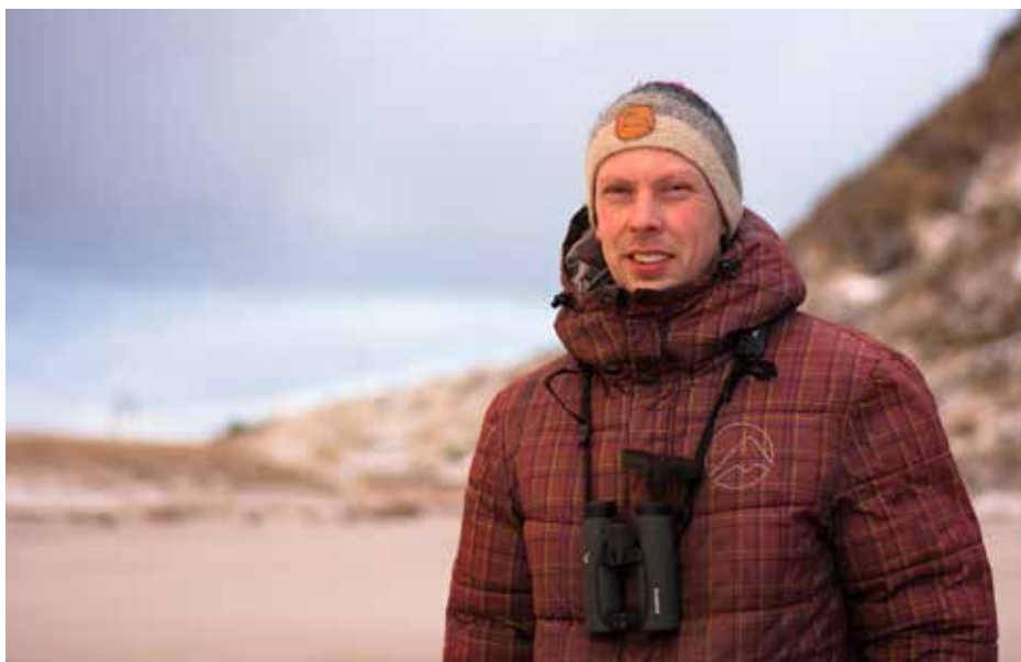
NOFs kontaktperson for naturvernsaker: Martin Eggen.