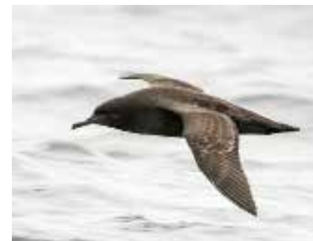
Grålire, Røst.

VÆRØY: 1 ind. Værøy 19.9 (Kjell Mjølssnes, Egil Ween, John Alsvik m.fl.). 2 ind. Værøy 20.9 (Egil Ween, Tore Berg). 1 ind. Værøy 24.9 (Sverre Birkelund). 1 ind. Nordland 26.9 (Kjell Mjølssnes, Tore Berg, John Alsvik m.fl.).