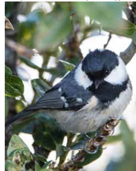
Svartmeis, Værøy.

Figur 1. Antall funn (venstre søyle for hvert år) og antall individer av pilfink rapportert