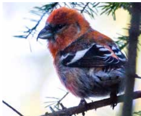
Båndkorsnebb hann på Offersøy camping, Alstahaug.

Takk til Nesna lokallag for et godt gjennomført program, og takk til Petter for en vellykket og fuglerik helg i ditt rike.