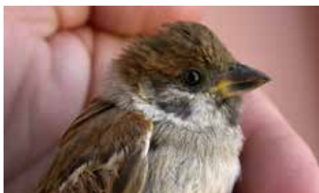
Bilde 1. Den første ungfuglen (1k) som ble merket 2. juli 2014 på Skogsøy, Nesna.

Det har rapportert til dels store antall pilfink også andre steder i Nordland i 2015, og det er mulig at det har vært hekkinger på Rognan (flere individer observert samtidig) og i