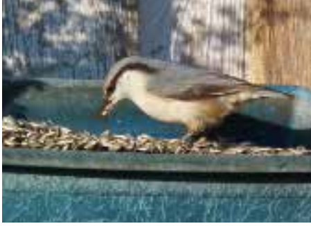
Spettmeis, Hemnes.