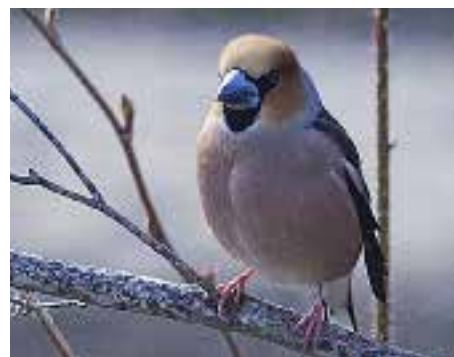
Kjernebiter, Evenes.

VÅGAN: 1 ind. Svolve 4.4 (Frantz Sortland). 1 ind. Laukvik 22.4 (Patrik Sævenstad). 1 ind. Laukvik 23.4 (Hege Pettersen). 1 ad. Stranda 1.5 (Frantz Sortland).