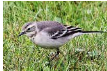
Sitronerle, Værøy.

RANA: 1 F-farget Storforsen 22.6 (Atle Ivar Olsen).