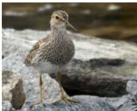
Alaskasnipe, Røst.

VÆRØY: 1 1K Sprengern 22.9 (Simon Rix m.fl.).