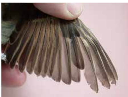
Bilde 2 og 3. Pilfink, ungfugl i myting. 26. juli 2015.