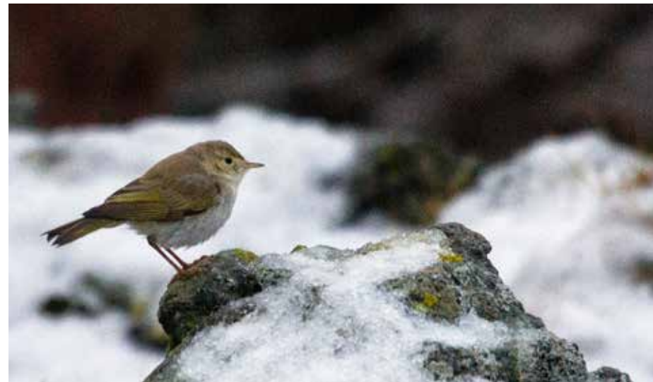
Eikesanger på Mulstøa - en av de store «bombene» høsten 2014.

svartmeisene ankom i midten av september (O. Heggøy, M. Eggen, J.O. Larsen m.fl.), og det skulle fort vise seg å være mengder i terrenget, med flokker på titalls fugler mange steder. Arten hekker relativt sparsommelig, men vanlig, i Nordland. Disse fuglene hadde opplagt ingen lokal opprinnelse. Uten at det trenger å være en direkte sammenheng, kan det nevnes at det på Puise-halvøya i Estland ble telt ikke mindre enn 50.000 trekkende svartmeiser i løpet av 5 timer cirka to uker før svartmeisene ankom Flakstad.