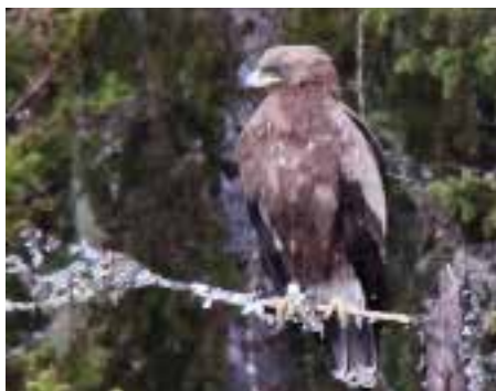
Storskrikørn. På bildet ses enden av en antenne, så trolig er dette individet «Tönn». Det var utstyrt med en sate-littsender som ikke lenger fungerer i 2014.

RANA: 1 ad. Langvassgrenda 17.5 (Tore Rausandaksel).