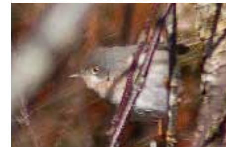
Rødstrupesanger, Rødøy. Foto: Kim Erlend Vidal

RØDØY: 1 2K+ F Sleipnesodden 4.5 (Kim Erlend Vidal).