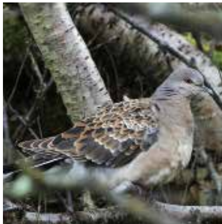
Mongolturteldue, Flakstad.

RØST: 1 ind. Stamnes 22.9 (Eirik Grønning-sæter). 1 1K Grav 25.9 (Klaus Maløya Torland, Inge Melhus, Thomas Bentsen m.fl.).