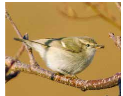
Blekbrynsanger, Fredvang.

det mye motivasjon å finne i å lete etter nye kommunearter og kommunekryss. I Flakstad er mulighetene store for stadig flere oppdagelser. Året 2015 var intet unntak, og det første året undertegnede bodde i Flakstad. Totalt 26 nye personlige kommunekryss ble notert, og når dette skrives er min egen kommuneliste på 160 arter.