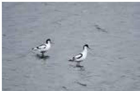
Avosett, Bodø.

BODØ: 2 2K+ Ilstad 24-30.4 (Torgrim Larsen, Thor Edgar Kristiansen, Ole Eirik Torsteinsen m.fl.).