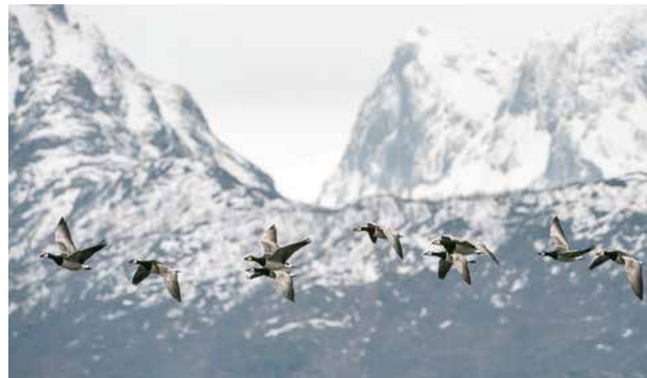
Hvitkinngjess, Vesterålen.