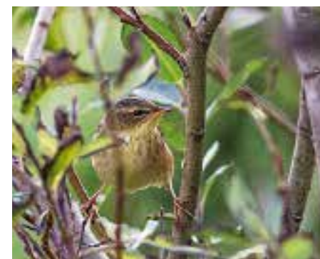
Starrsanger, Røst. Foto: Håvard Eggen

RØST: 1 1K Røstlandet 1.10 (*Håvard Eggen).