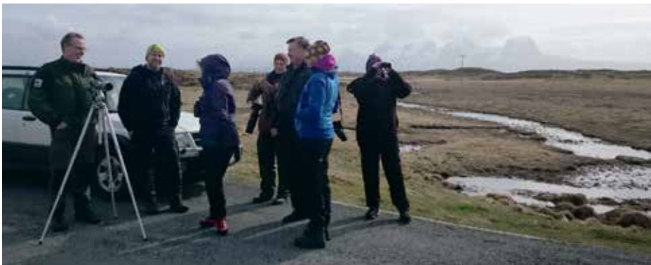
Fra ekskursjonen til Herøy lørdag 9. mai. Landemerket De syv søstre på Alstenøya i bakgrunnen.

men på grunn av dem ble årsmøtet litt forsinket. I det vakre bygget til ære for Petter, Petter Dass-museet, ble årsmøtet avholdt. Det gikk relativt raskt og greit, og nytt styre ble valgt.