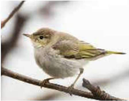
Eikesanger, Flakstad.