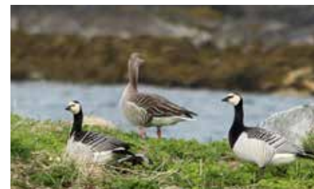
Hvitkinngjess og en grågås på Herøy.

Jeg haver den Sagn udaf Skytterens Mund, Forfarenhed vil det vel lære.