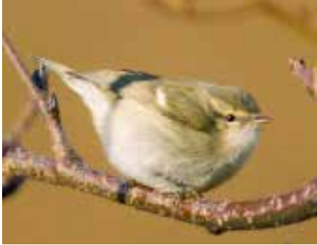
Blekbrynsanger, Flakstad.