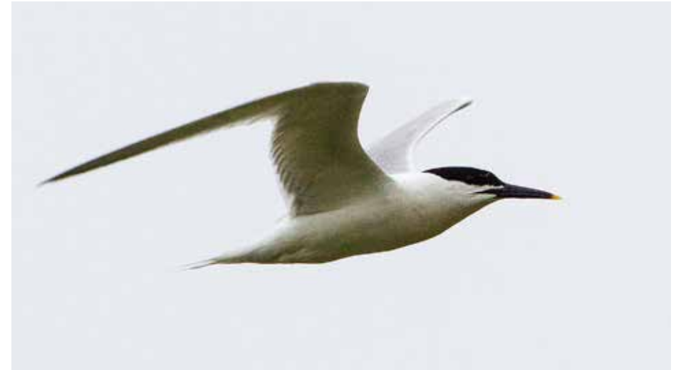
Splitterne, Yttersand.

For alle sjeldenhetsjegere er det vest som gjelder. Lengst mulig vest, gjerne med åpen kystlinje i alle retninger, slik at den «absorberbare overflaten» blir størst mulig, der fugler ute av kurs trekkes til land som småunger rundt en godtepose. Flakstadøy ligger vest i Lofoten, men både Moskenesøy, Værøy og Røst ligger lenger sørvest på Lofotens vei ut Atlanterhavet. Til gjengjeld finnes det her mange