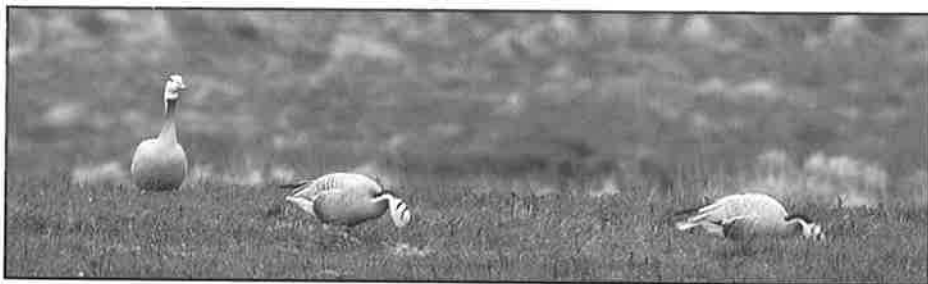
Stripegås - flyttet fra kategori C til E.