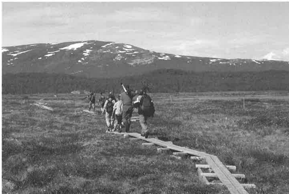
Våtmarkene i Stordalen naturreservat.