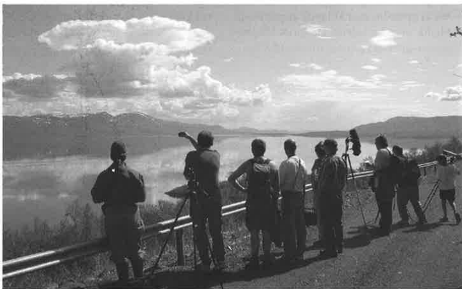
I lappsangerlien - utsikt mot Torne Träsk.