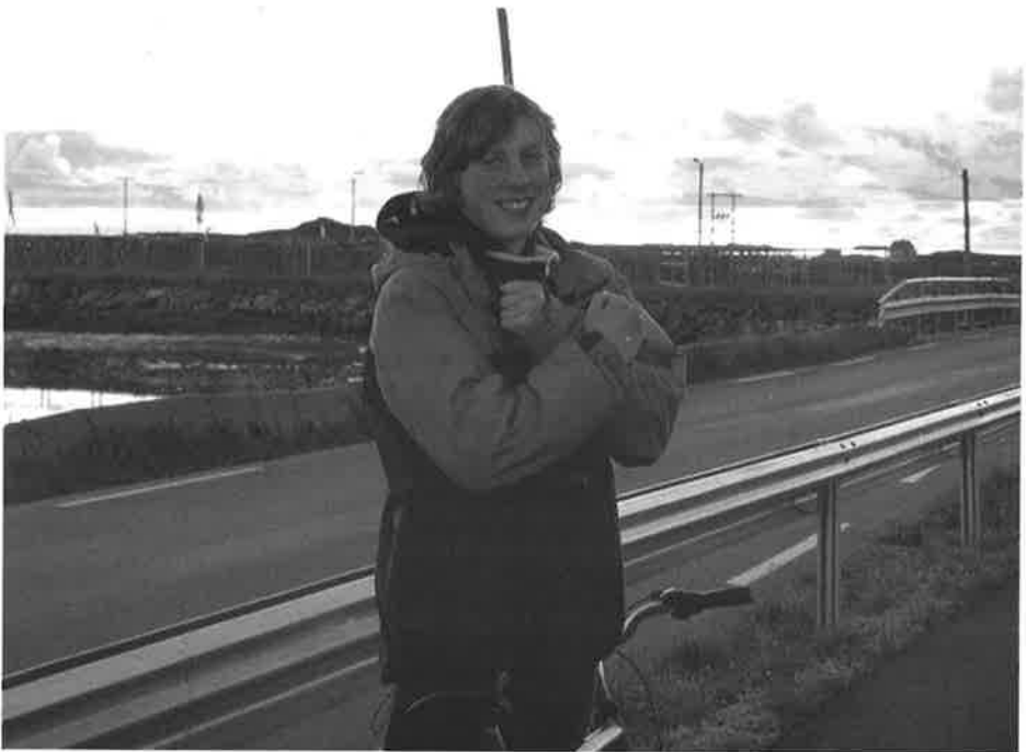
En lykkelig artikkelforfatter markerer "kryss" med armene etter å ha sett kanadalo på Røst.

Jeg spurte her om dagen ei venninne om hva hennes drømmeøy ville vært. Hun svarte azurblått hav, hvite strender, så varmt at vannet boblet og palmer med hengende frukter som var skydd mot den sterke sommersolen. Vet du hva jeg svarte? Røst.