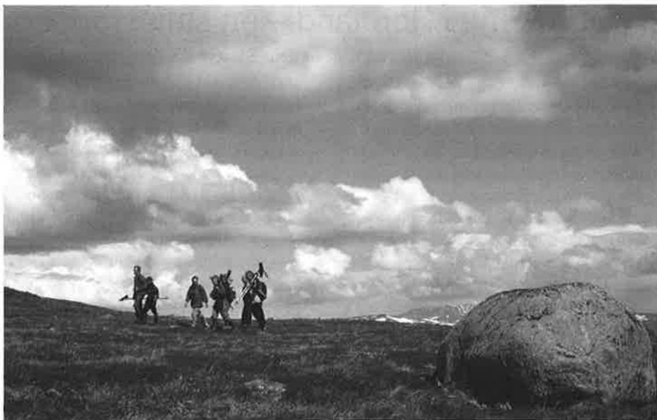
Ovenfor fjellheisen i ca 1000 m høyde. Boltit forut!