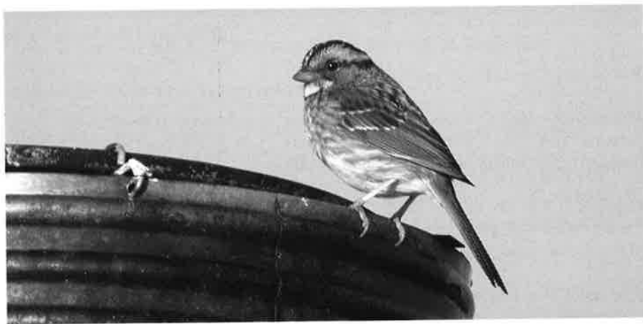
Hvitstrupespurv.