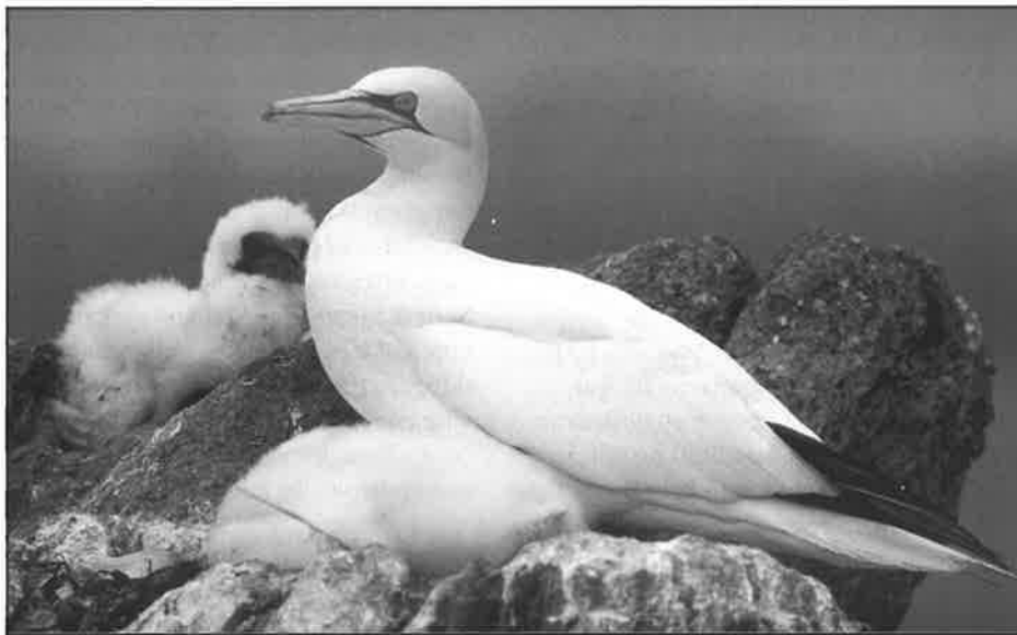
Havsula har endret hekkemønster i fylket i rapporteringsperioden.