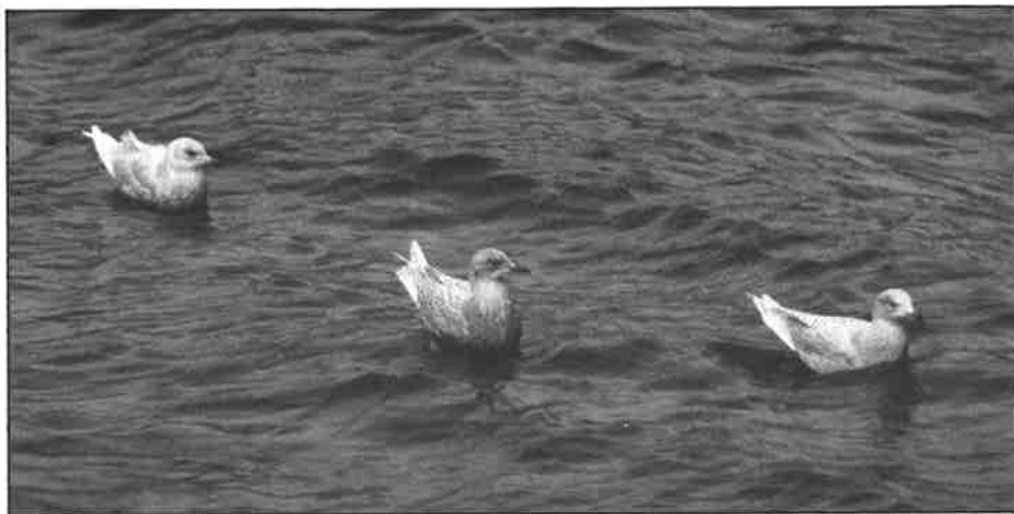
3 Grønlandsmåker side ved side i Henningsvær 13/1-02.

Vågan: Min. 5 ind. Henningsvær 13/1 (JOS).