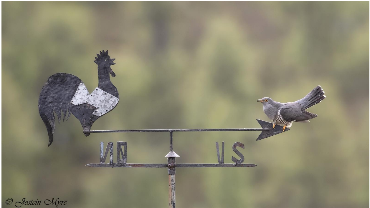
Årets fuglebilde i Buskerud: Gjøk på Nystølen, Hol 6. juni 2021.