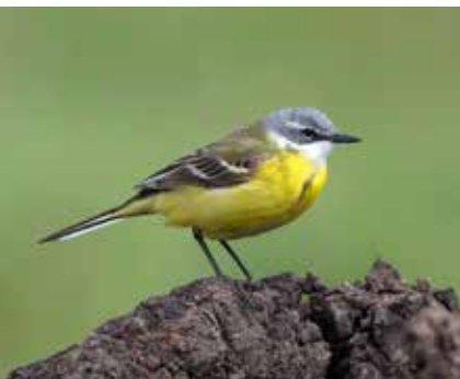
Sørlig gulerle.