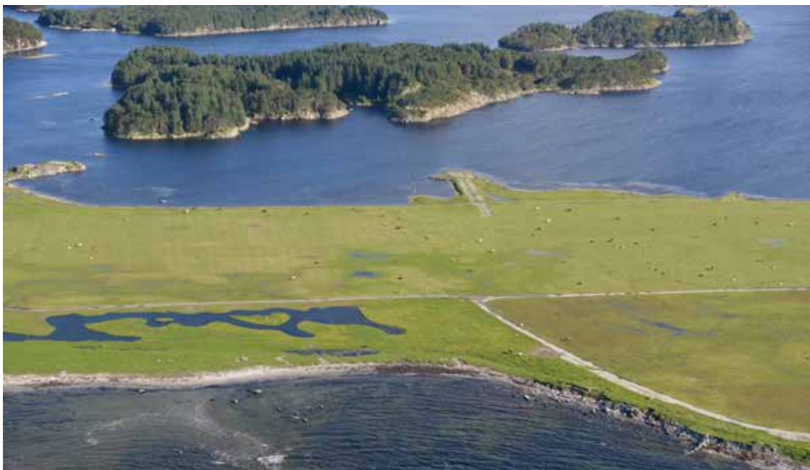
På Herdla, Askøy utenfor Bergen er det etablert fuglevennlige dammer.

næringsstoffer som nitrogen og fosfor, og bidra til karbonlagring og dempe fare for flom og erosjon. I fangdammer er disse naturlige selvrensingsprosessene forsøkt optimalisert. Rensemetsoden i fangdammer er oftest bygget på prinsippet om sedimentering. Uønskede organiske og uorganiske partikler følger bekkevannet inn i renseparken, hvor de blir bunnfall på grunn av tyngdekraften. Åpne dammer med lite skyggende trær og busker gir en langt større mengde insekter enn de som er omkranset av høy vegetasjon, og også klart mer fugleliv. Dermed kan fjerning av vegetasjon rundt eksisterende dammer være et godt tiltak for insekt- og fugleliv i kombinasjon med etablering av nye dammer.