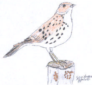
Tegning : Christoffer Mikalsen

Til slutt vil jeg få takke alle for en kjempefin tur og helg, jeg følte ikke at det var noen særlig aldersforskjell mellom oss heller, 50 år er vel ikke noe å snakke om. Jeg kunne spørre og grave om det meste, og fikk kikke i teleskopene når det var noe. Så igjen : TAKK ! Artsliste for turen står på neste side.