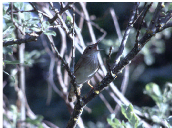
Elvesangeren ved Fiskumvannet.

(Store deler av Vest-Palearktis. Vanlig hekkeart i Sør-Norge. Trekkfugl som overvintrer lenger sør i Europa og Nord-Afrika. Enkelte individer kan også overvinstre i Norge i milde vintrer, og opptrer da ofte på foringsbrett). Det foreligger få rapporterte vinterfunn til LRSK fra Buskerud, men i VinterAtlas er arten til nå registrert i til sammen 7 ruter, inkl. Geilo og Hovet i nordfylket.