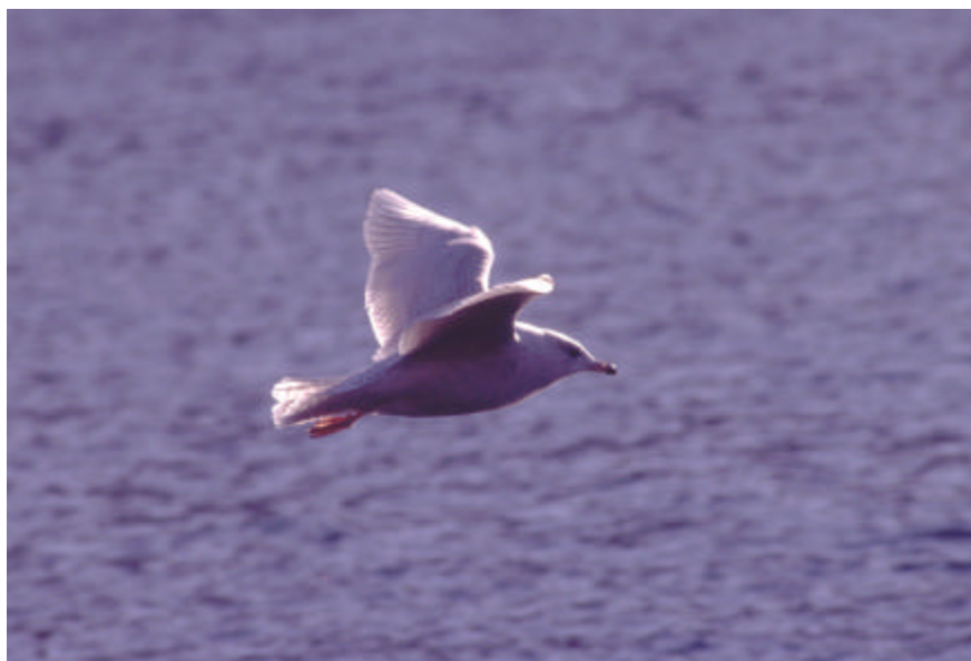
Grønlandsmåke ved Stensetøya.

1999 NEDRE EIKER: 2K Krokstadelva 30.01. – 14.03.* (F) (J.L. Hals, L.T. Poppe m.fl.). ØVRE EIKER: 3K Fiskumvannet 25.04. (J.L. Hals, J.T. Johnsen).