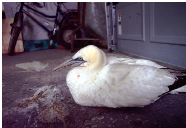
Havsule i pleie i Lier.

(Skottland, Skandinavia og østover til Sibir). Storlomen hekker spredt i midtre og indre deler av Buskerud. Arten er regelmessig på vårtrekket i april-mai i Fiskumvannet og Tyrifjorden, mer sporadisk på høsttrekket.