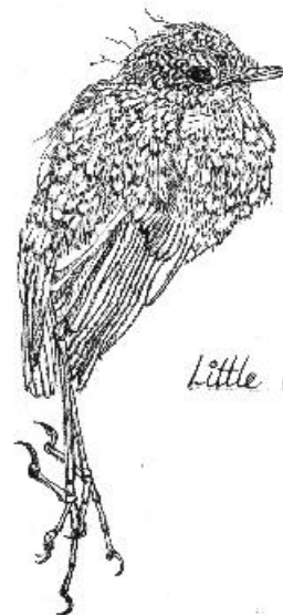
Little dead baby bird. 23/8.2000 Helen Lorraine

Tekst og tegning : Helen Lorraine Jacobsen.