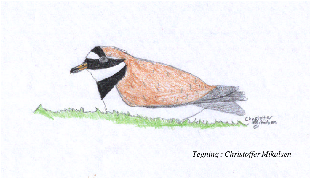
Tegning : Christoffer Mikalsen