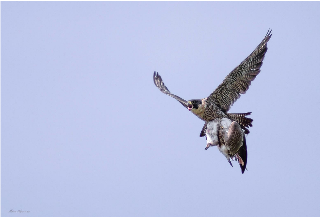
Årets fuglebilde i Buskerud 2022: Vandrefalk med fiskemåke i klørne, Linnestranda 30.8.2022.