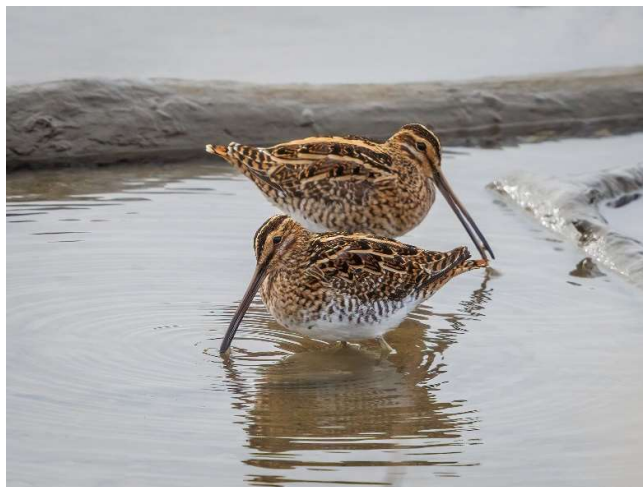
Månedens bilde i mars.