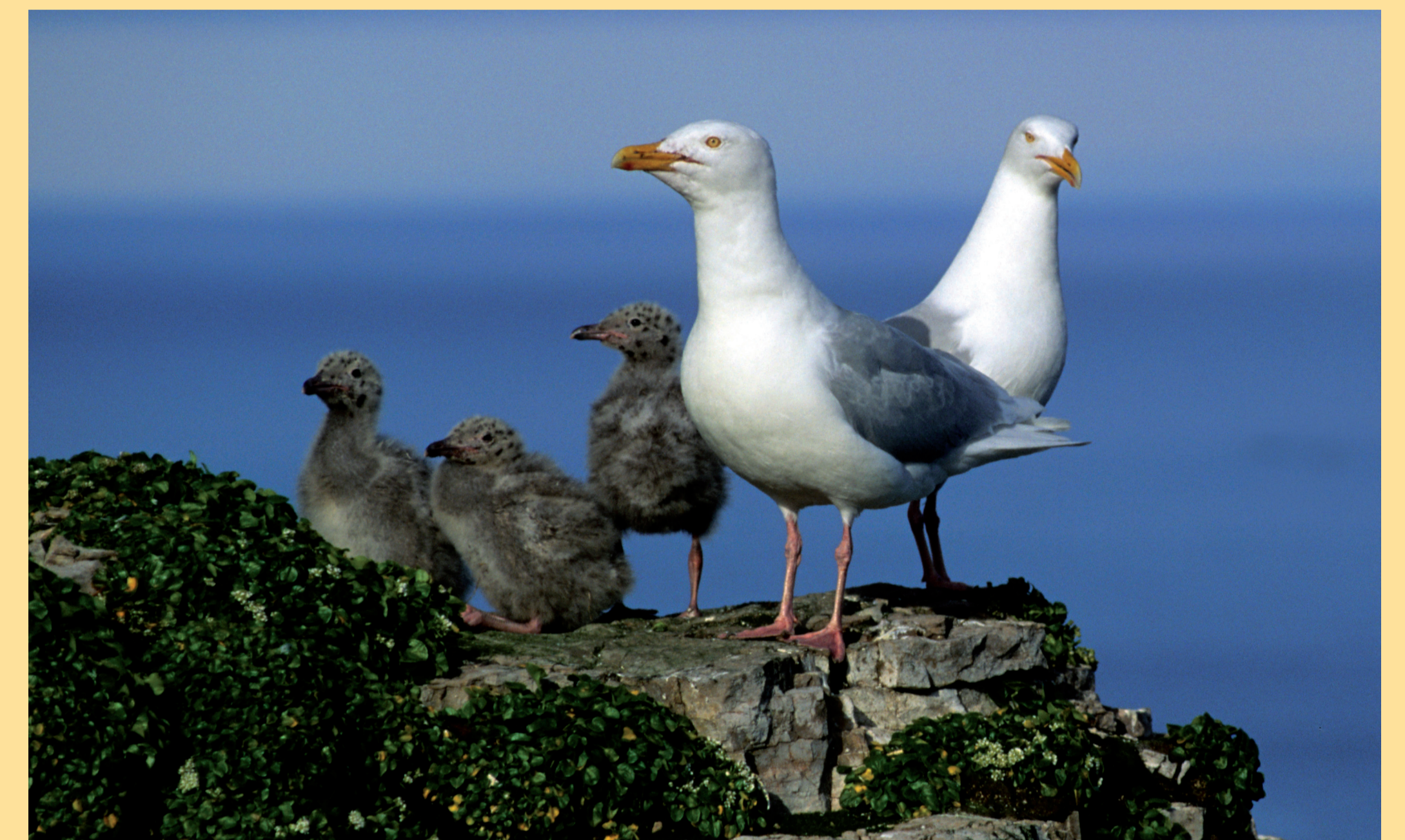
Polarmåka hekker over hele Svalbard, ofte i nærheten av andre sjøfuglkolonier. Begge makene passer godt på ungene. At de klarer å fostre opp tre unger er likevel ikke vanlig.

Ved at polarmåka er på toppen av næringskjeden, er den utsatt for miljøgifter. På Bjørnøya er det registrert svært høye nivåer, spesielt hos dem som lever av egg og fugleunger. Fuglenes hormonproduksjon og immunforsvar påvirkes av miljøgiftene, noe som igjen påvirker både hekkesuksess og voksenoverlevelse. På Bjørnøya har bestanden vist en klar tilbakegang siden 1980-tallet. Årsaken kan være miljøgifter, muligens kombinert med bestandsnedgang for lomviartene. Ikke sjelden dør hekkefugler plutselig ved reiret, og årsakene kan være direkte eller indirekte påvirkning av miljøgifter.