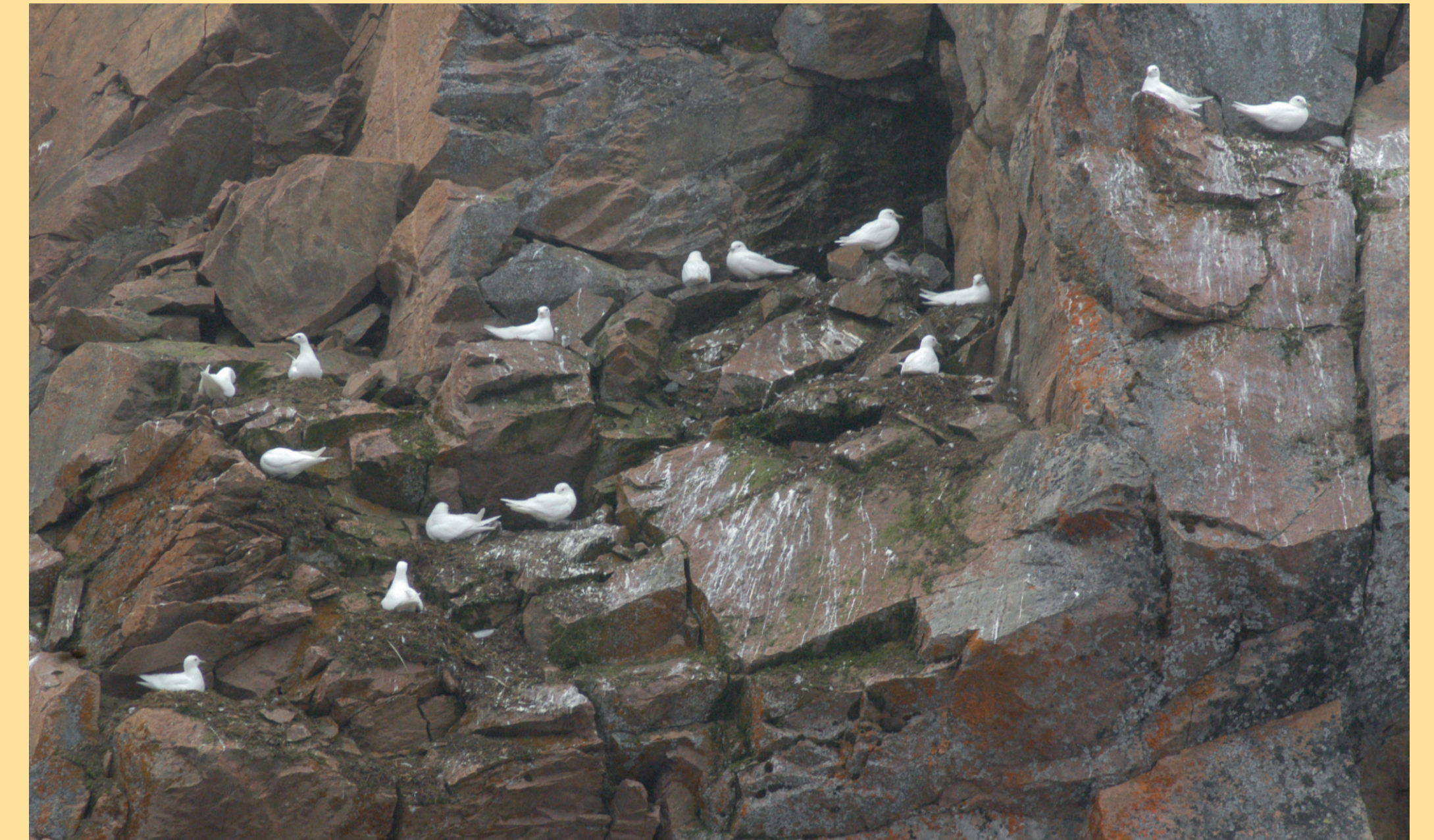
Ismåkekoloni på Nordaustlandet (Svalbard) i 2006. Noen kolonier på Svalbard er mer stabile enn andre. Denne kolonien var kun aktiv i én sesong.

Bruk av satellittsendere de siste årene har gitt ny og verdifull informasjon om trekkveier og overvintringsområder. Fugler fra Svalbard overvintrer for en stor del i Labradorhavet/Davisstredet mellom Grønland og Canada. Der samles fugler fra flere atlantiske bestander, før de på våren igjen returnerer til sine gamle og tradisjonelle hekkeområder i Arktis.