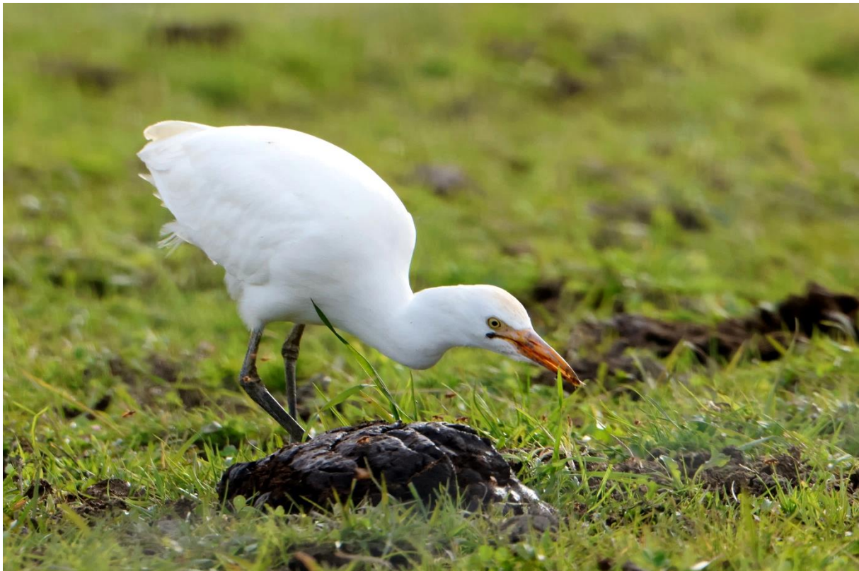
Det første bildet som Andreas Pedersen tok av kuhegra på beitemarka kl. 13:58 den 12.10.23.

Kuhegre er ny art for Øvre Eiker og Fiskumvannet. For Fiskumvannet ble dette dessuten et spesielt funn da denne kuhegra ble art nr. 250 for lokaliteten (eksklusiv 6 ikke-spontane arter som bl.a. svartsvane, fasan og rapphøne). Dette var dessuten bare det andre funnet av arten i Buskerud etter førstefunnet som ble gjort på Steinssletta i Hole 22.-26.04.21 (Stueflotten 2022).