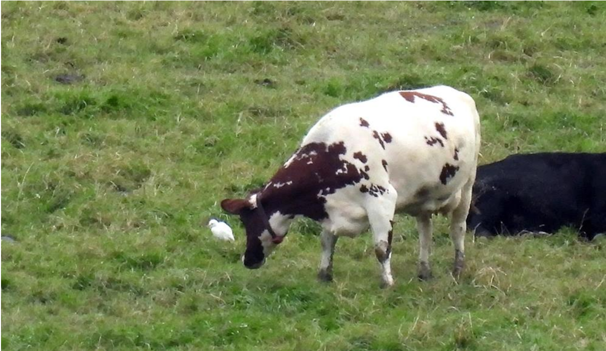
Kuhegra sammen med kyr på Vålen ved Vestfossen 20.10.23.

Fra neste dag den 21. oktober foreligger det ingen kjente observasjoner av kuhegra. Befant den seg fortsatt i Øvre Eiker, eller hadde den dratt videre? Jeg tok derfor en ny tur neste dag for å søke på mulige lokaliteter fra dagene før. I Bergsvingen oppdaget jeg en lys, nesten hvit, leukistisk gråtrost i en flokk borte på Sørby. Jeg kjørte derfor rundt om Vestfossen til østsida for om mulig å få sett nærmere på og tatt bilder av denne spesielle gråtrosten. Men da jeg kom til Sørby, var den borte. Jeg fortsatte videre mot Langebru for å snu og kjøre tilbake mot Hegstad og beitemarka der. Fra Voldstadveien ser jeg plutselig en helt hvit fugl som sitter øverst i alléen opp til gården på Åker. I kikkerten ser jeg med en gang at det er kuhegra som sitter der sammen med noen tyrkerduer. Gjenfunnet for andre gang på nok en ny lokalitet i kommunen! Etter å ha studert den grundig i teleskopet og tatt noen bilder på langt hold, la jeg ut en melding på Band om at den var gjenfunnet på Åker ved Hokksund kl. 11.