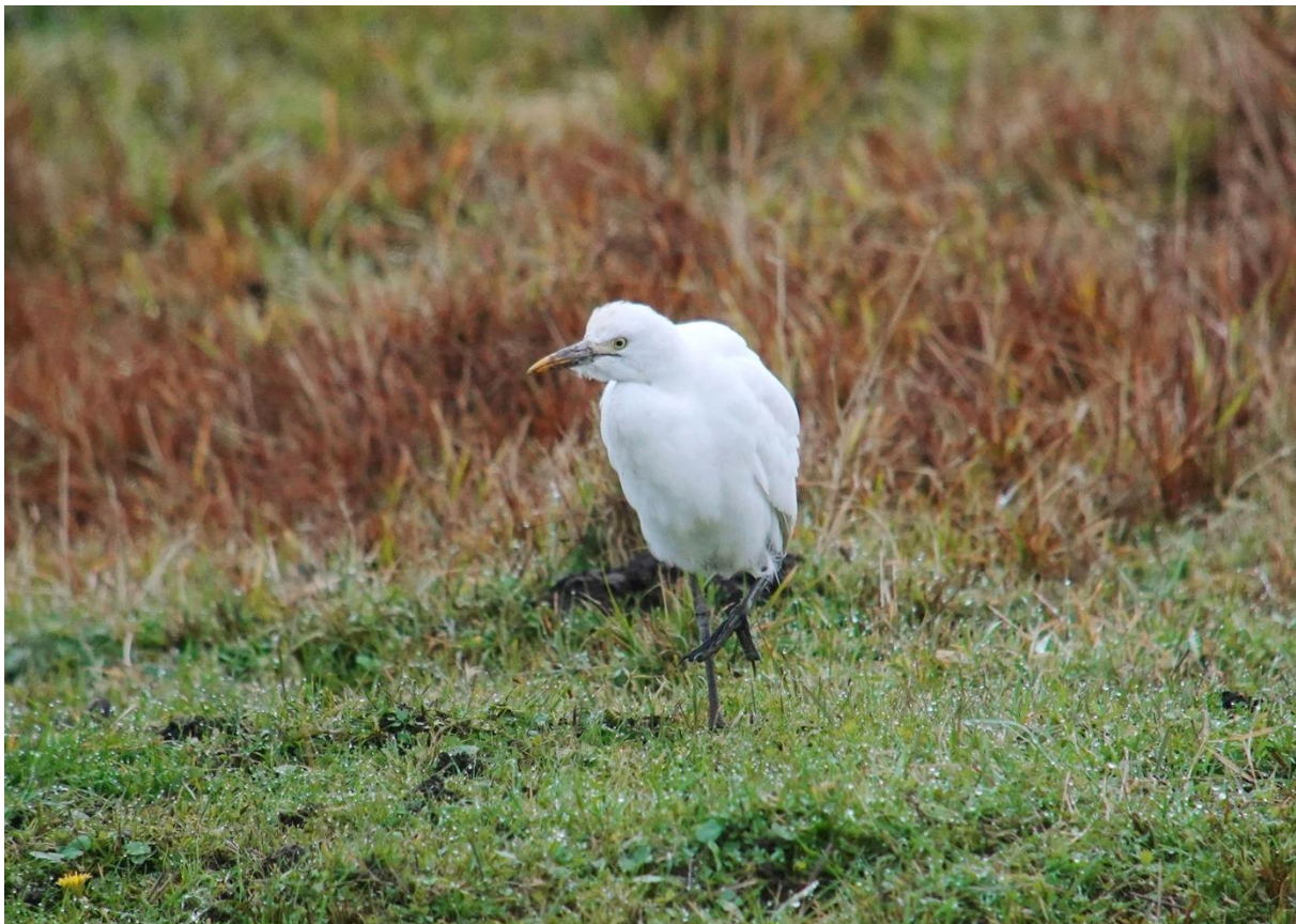
Kuhegra på Hegstad beitemark kl. 10:15 den 23.10.23.