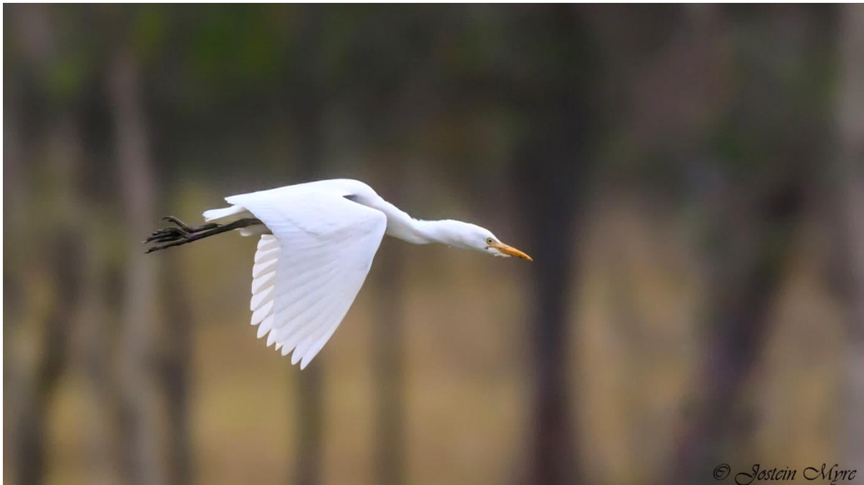
Kuhegre i flukt over Hegstad beitemark, Øvre Eiker 13.10.23.