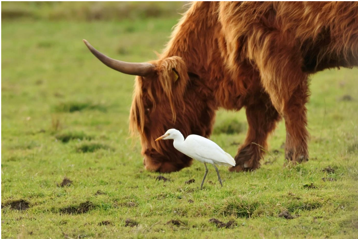
Næringsøkende kuhegre sammen med ku på Hegstad beitemark 12.10.23.