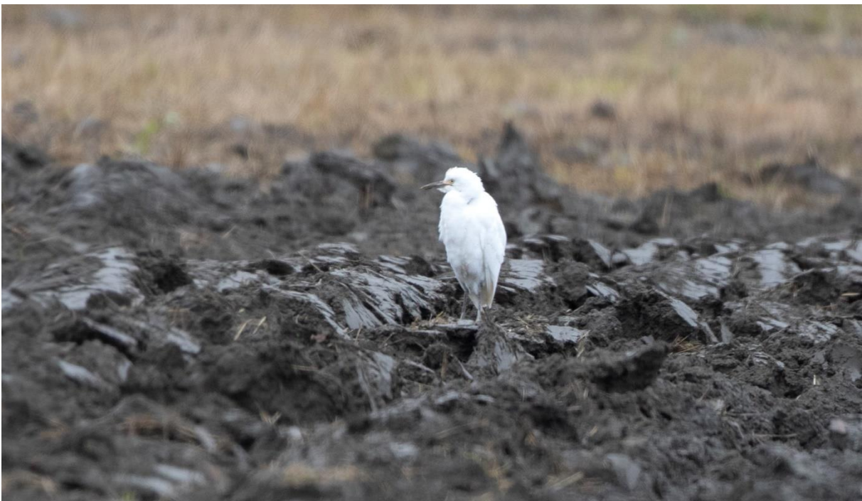
Kuhegre på et nypløyd jorde ved Åker 22.10.23.

Fra neste dag den 21. oktober foreligger det ingen kjente observasjoner av kuhegra. Befant den seg fortsatt i Øvre Eiker, eller hadde den dratt videre? Jeg tok derfor en ny tur neste dag for å søke på mulige lokaliteter fra dagene før. I Bergsvingen oppdaget jeg en lys, nesten hvit, leukistisk gråtrost i en flokk borte på Sørby. Jeg kjørte derfor rundt om Vestfossen til østsida for om mulig å få sett nærmere på og tatt bilder av denne spesielle gråtrosten. Men da jeg kom til Sørby, var den borte. Jeg fortsatte videre mot Langebru for å snu og kjøre tilbake mot Hegstad og beitemarka der. Fra Voldstadveien ser jeg plutselig en helt hvit fugl som sitter øverst i alléen opp til gården på Åker. I kikkerten ser jeg med en gang at det er kuhegra som sitter der sammen med noen tyrkerduer. Gjenfunnet for andre gang på nok en ny lokalitet i kommunen! Etter å ha studert den grundig i teleskopet og tatt noen bilder på langt hold, la jeg ut en melding på Band om at den var gjenfunnet på Åker ved Hokksund kl. 11.