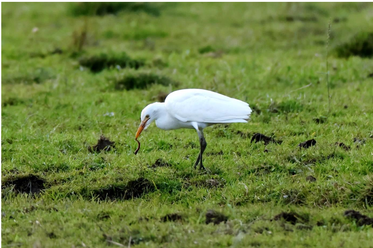
Her har kuhegra funnet seg en meitemark på Hegstad beitemarka 12.10.23.