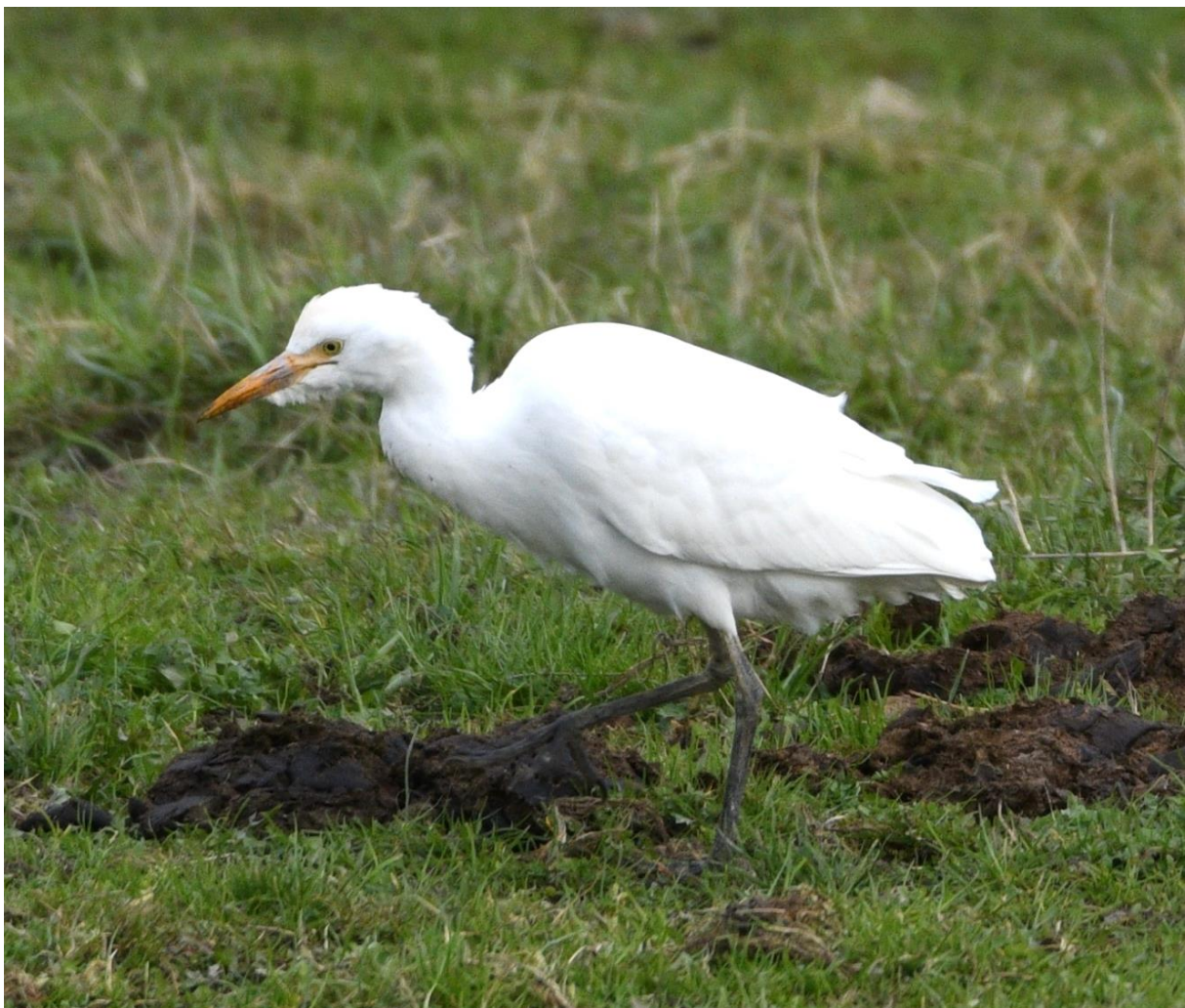
Kuhegre på Hegstad beitemark 12.10.23.