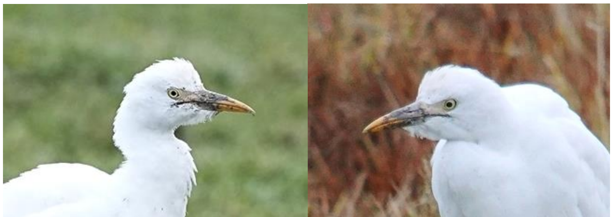
Hbm 23.10.23