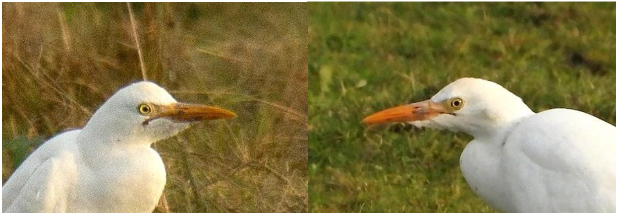
Hbm 12.10.23

Nedenfor har jeg sammenstilt to beskårne bilder av hodet til hver av kuhegrene som ble observert på Hegstad beitemark (Hbm) 12. oktober og 23. oktober. Det må nevnes at den 12. oktober ble bildene tatt i fint vær med solskinn og +10 grader, mens den 23. oktober var været overskyet og mer grått og kjølig med +3 grader. Dette kan ha påvirket det visuelle inntrykket som vi får av fuglene på bildene.