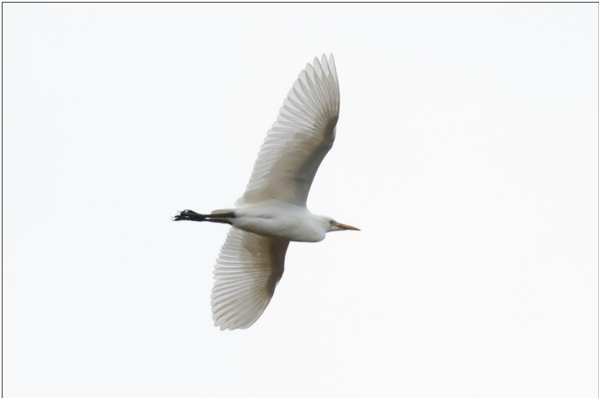
Ett av de siste bildene som ble tatt av kuhegra før den forsvant sørover 13.10.23.

Det bør nevnes at det den 01.10.23 ble observert to kuhegrer sammen i Gjerpensdalen og Børsesjø ved Skien, og at det trolig var en av disse som noen dager seinere dukket opp i Sandebukta, Holmestrand 10.10.23 (ref. Artobservasjoner.no). Det er også rimelig å anta at kuhegra som ble observert på Hegstad beitemark 12. og 13. oktober, var en av disse. Etter at kuhegra på Hegstad hadde forlatt Øvre Eiker 13.10.23, ble et individ sett i Lahellebukta ved Sandefjord den 15.10.23. Kanskje var dette den samme kuhegra?