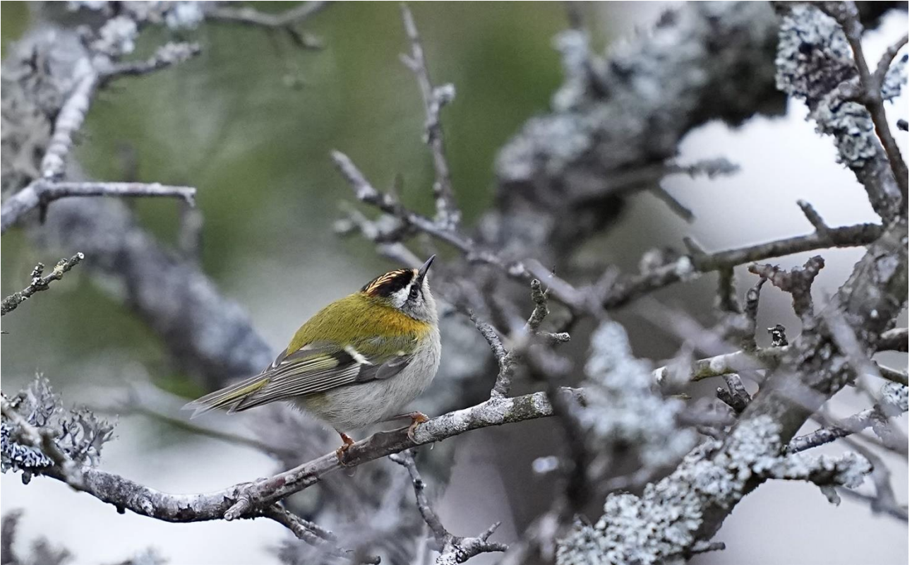
Årets fuglebilde i Buskerud 2023: rødtoppfuglekonge på Loretangen i Hole 13.04.23.