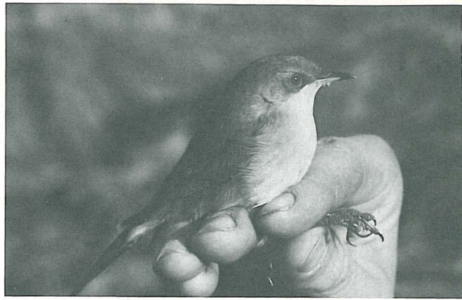
Svarthodesanger, Akerøya 3.10. 1982.