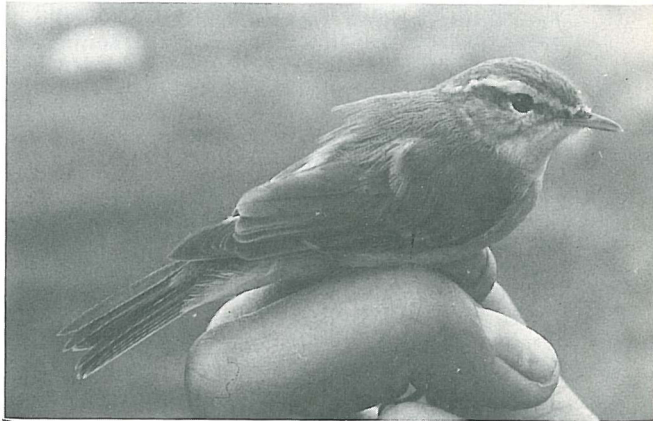
Østsanger, Utsira 31.8. 1982.