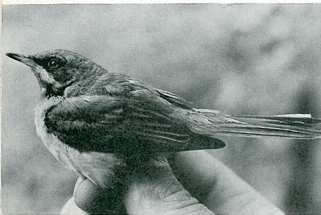
Rødstrupesanger, Utsira mai 1982.