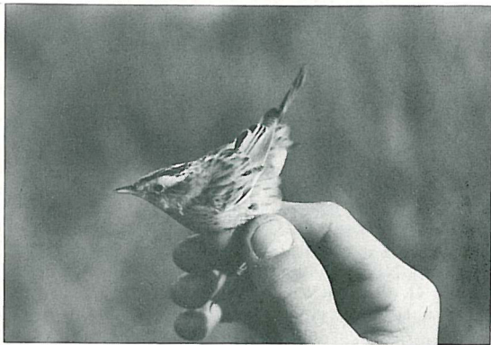
Vannsanger, Karmøy 4.8. 1982.