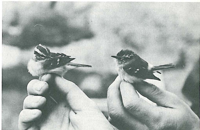
Fuglekongesanger, Utsira 11.10. 1982.