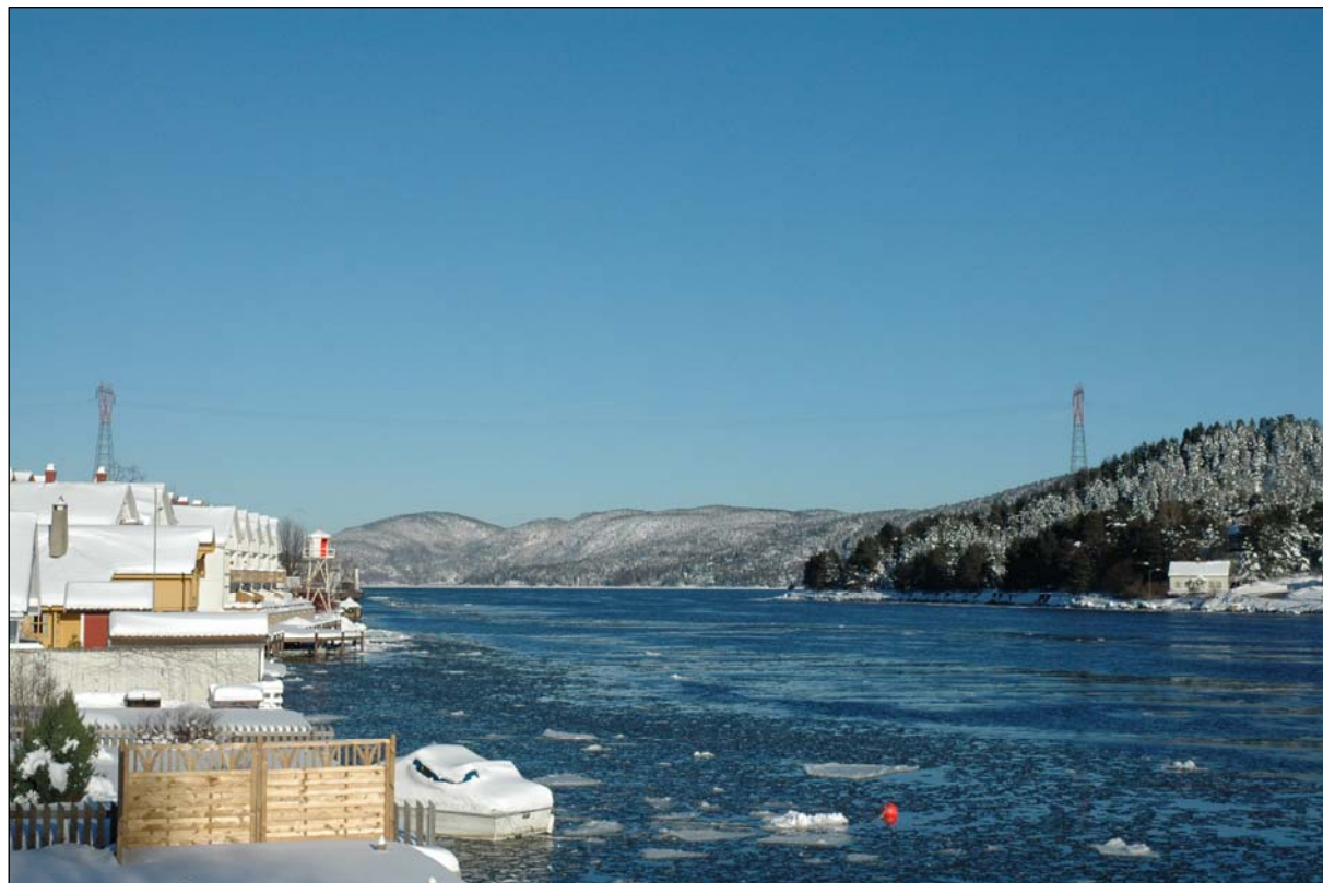
Foto 1. Svelviksundet sett fra Svelvik sentrum, på sørsiden av kraftledningen (Foto: Terje Lislevand).

På vestsiden av Svelviksundet er landskapet preget av en relativt tett bebyggelse i Svelvik sentrum, med et industriområde og en trafikkert vei like under ledningen. Landskapet på