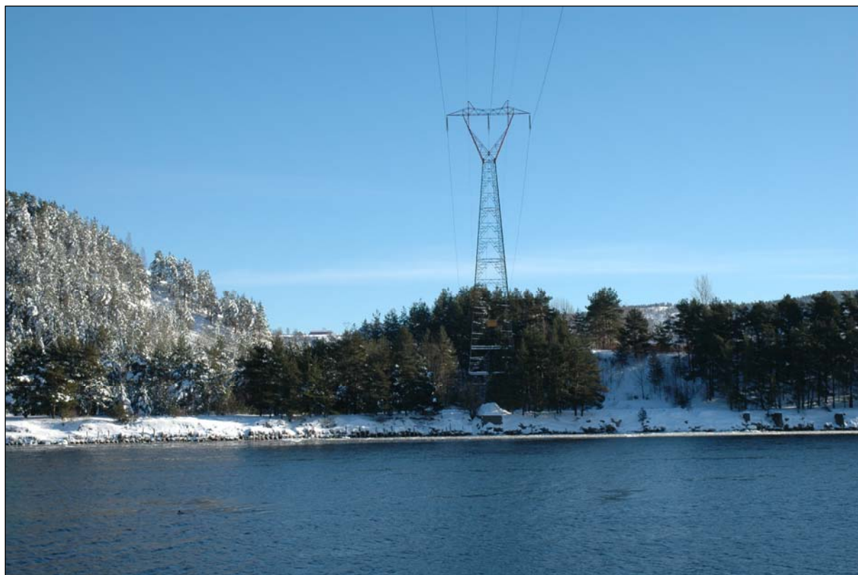
Bilde 2. Kraftledningen sett fra Svelviksiden. Fuglen nede til venstre er en kvinand.

observert minst 32 kvinender hvorav ca. 10 lå like ved kraftledningen, to stökkender, rundt 20 gråmåker, én fiskemåke og to storskarver. Flere av endene og begge skarvene ble sett flygende under kraftledningen, og flere måker svedde rundt både over og under luftspennet over sundet. Også 2-3 fossekaller hadde tilhold i sundet, og holdt seg på isflakene nær land like nedstrøms fra fergeleiet i Svelvik sentrum. Mer landtilknyttede arter som ble observert inntil kraftledningen omfatter en hønsehauk som fløy under linene over sundet, skjære (3-4), kråke (5), pilfink (3), gråspurv 10), kjøttmeis (1), blåmeis (1), gråtrost (1) og gulspurv (2).